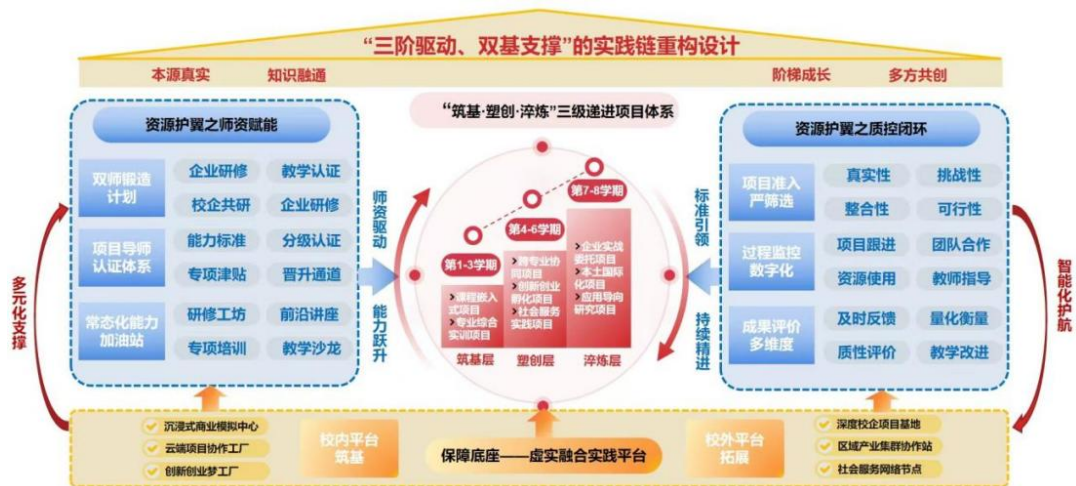
图3 “三阶驱动、双基支撑”商科实践链

源，构建起“三阶驱动、双基支撑”的实践教学体系。其中“三阶驱动”作为能力培养主轴，形成“筑基-塑创-淬炼”三级递进项目体系，筑基层（1-3 学期）通过课程嵌入式项目和专业综合实训项目夯实专业基础技能；塑创层（4-6 学期）依托跨专业项目、创新创业孵化项目与社会服务实践项目推动知识融通与提升；淬炼层（7-8 学期）以企业真实委托项目、本土国际化项目和应用导向研究项目锤炼复杂商业问题创新解决能力。“双基支撑”作为资源保障体系，一方面以师资与质控双维保障构成体系运行的核心“两翼”，另一方面凭借校内外虚实融合平台筑牢资源支撑的坚实“底座”，为整个实践链教学体系的有效运转提供全方位支撑。